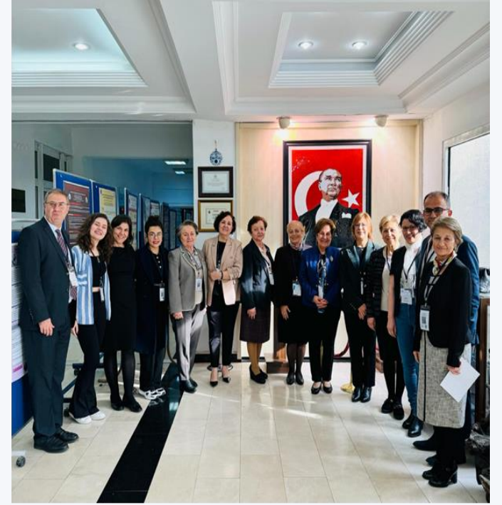
Sürecin sonunda fakülte tarafından düzenlenen toplantı ve belge takdimi